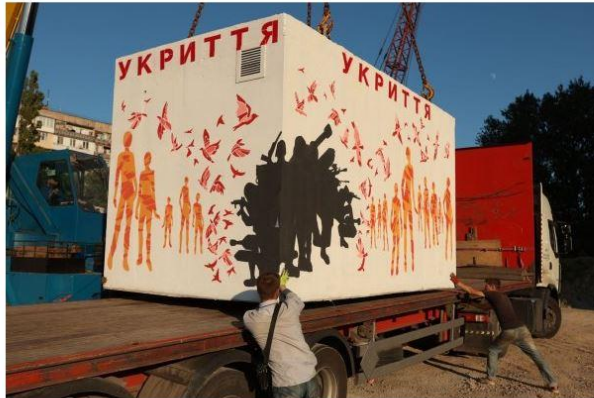
Der vom Künstler Dennis Josef Meseg gestaltete Schutzraum aus Beton wird auf einen Lastwagen verladen.