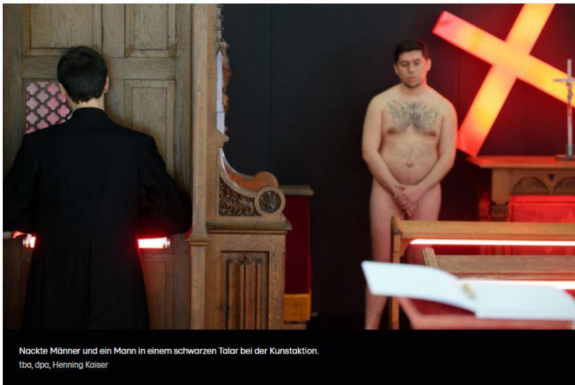
Nackte Männer und ein Mann in einem schwarzen Talar bei der Kunstaktion. tba, dpa, Henning Kaiser