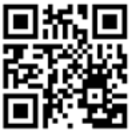
Über die Installation „It is like it is“

Mit Hilfe von insgesamt 27 Helfern, mehreren Kleintransportern, über 21 Kilometern Flutterband und jeder Menge Eigeninitiative wurden über 19.000 km zurückgelegt und „It is like it is“ an über 140 Standorten in 41 Städten Deutschlands gezeigt.